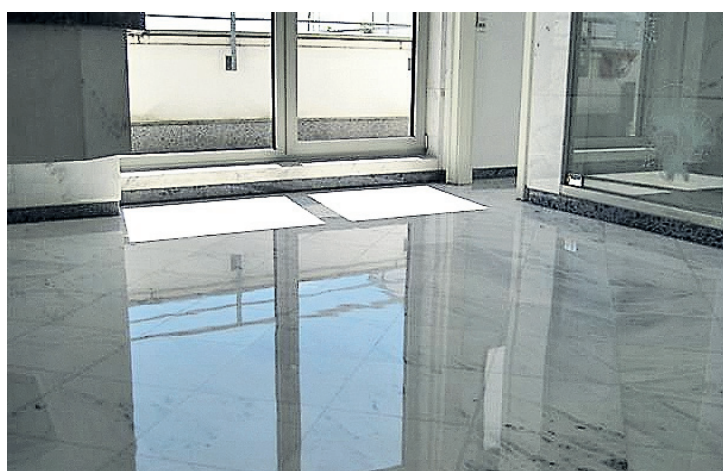
Eine glänzende Sache: der Fußboden nach der Behandlung